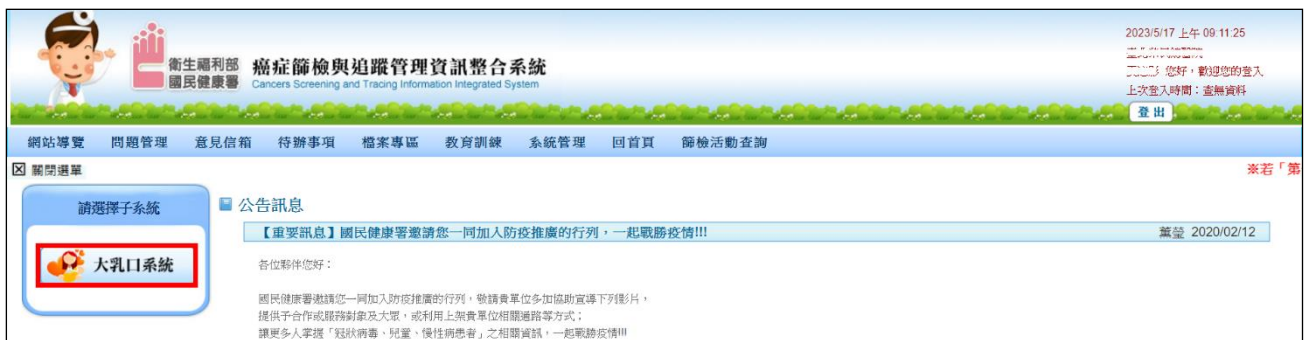
圖 1.系統登入後畫面

請於通知期限內至整合系統(原單一入口， https://portal.hpa.gov.tw )進行帳號登入後，透過網站 右上角 或 左側 之帳號簽入介接到癌整系統，並於左方 請選擇子系統 點選「大乳口系統」後，點選「婦女乳癌篩檢」進入到系統功能操作畫面。