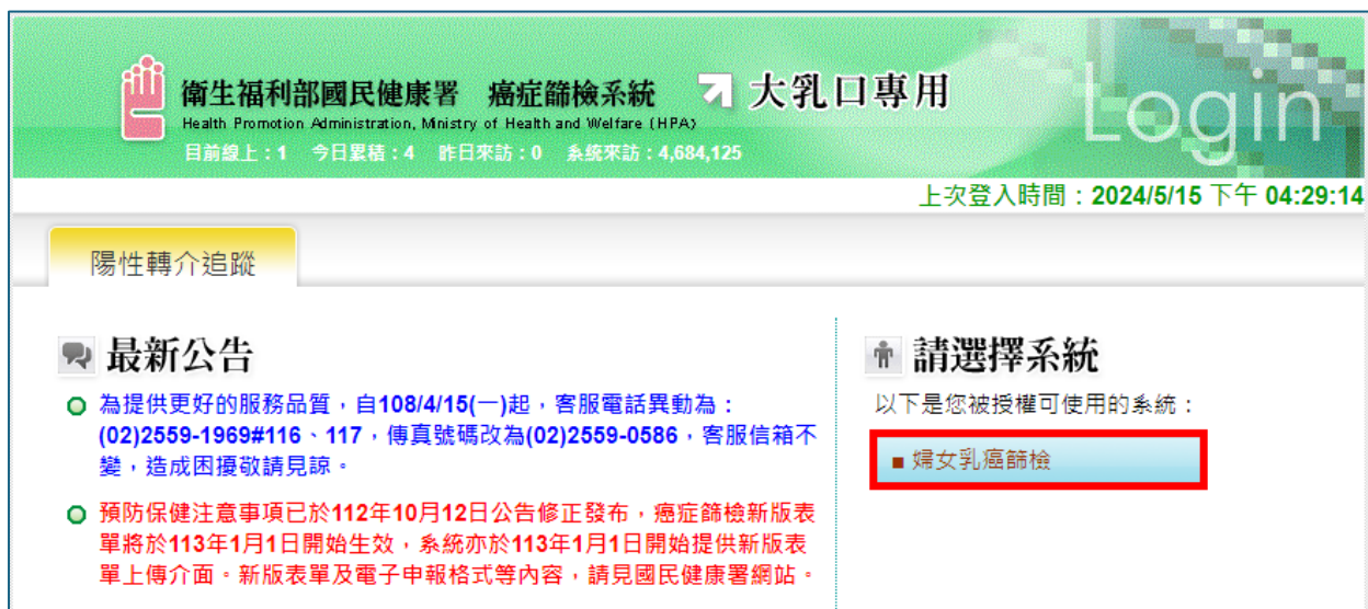
圖 2.介接至大乳口系統之婦女乳癌篩檢系統畫面